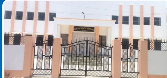
Siroya Indoor Stadium