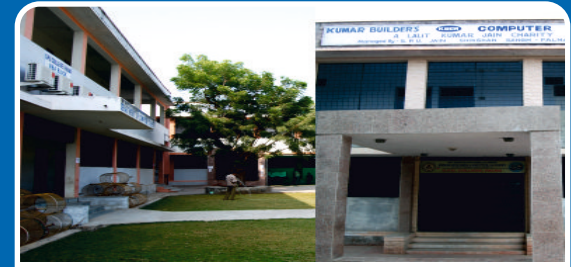
Kumar Builder's Computer Academy